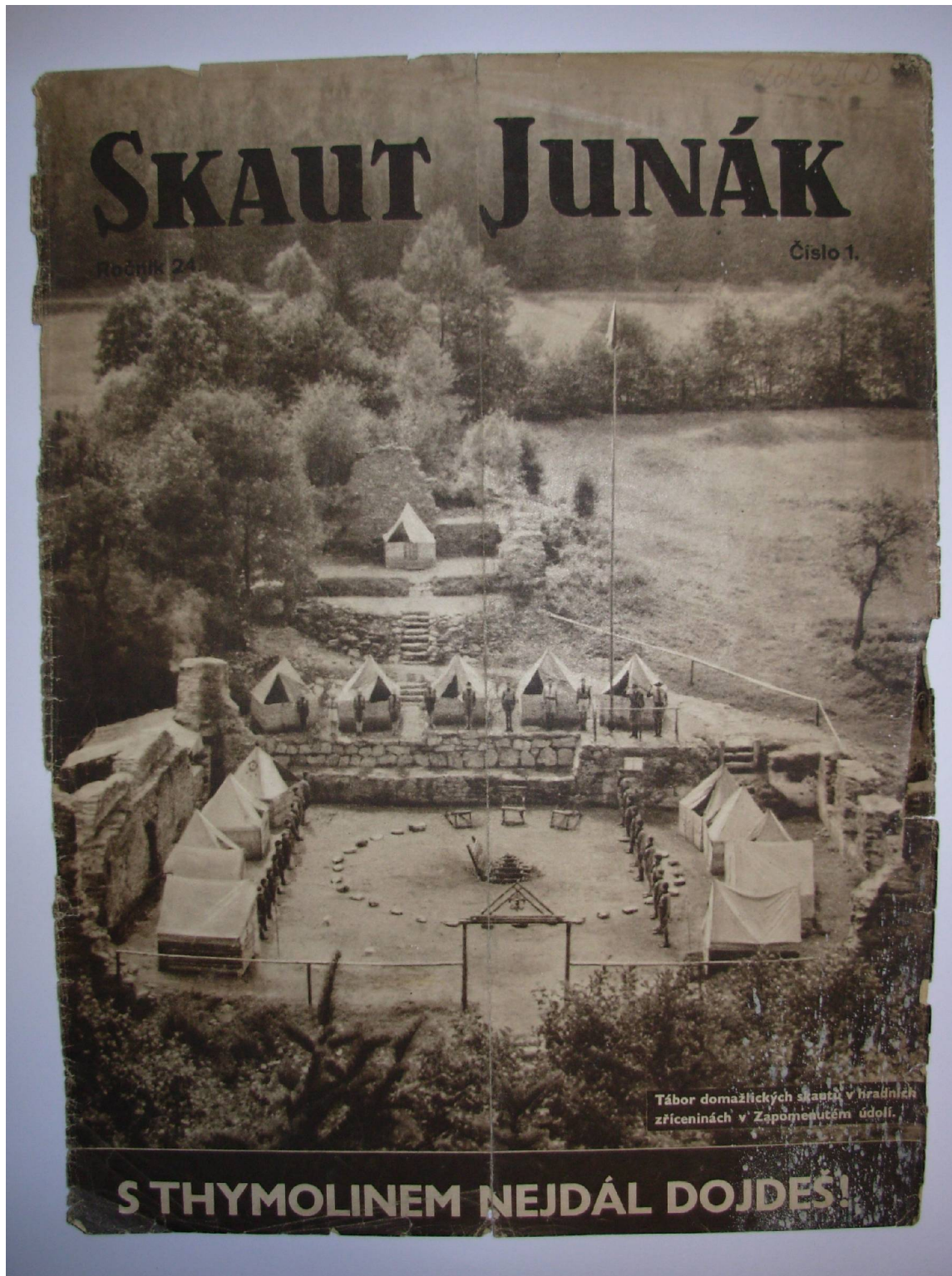
Obrázek byl použit z obálky prvního čísla časopisu Skaut – Junák ročník 24 – z roku 1937-38. Říkalo se jim "Thymolinová čísla"