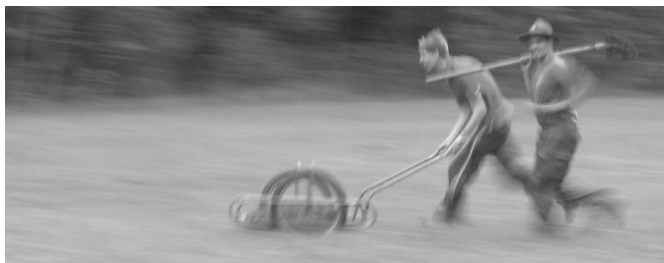
Byl to prostě foř... :-)

na tebe "nevyjde tolik dřeva". Vezměte to ale z jiného pohledu: dokázali jsme sobě i jiným, že to dokážeme. Já jsem jako kluk četl "foglarovky" (a mám-li čas, čtu je dosud) a chtěl jsem být na táboře, který si s kamarády sami postavíme. Předtím, než jsem před jedenácti lety přišel do Příbramského oddílu Vlků - čtvrtého oddílu (a chvíli předtím skautoval v Březnici), jsem byl na dvou táborech a tam mi právě tohle chybělo.