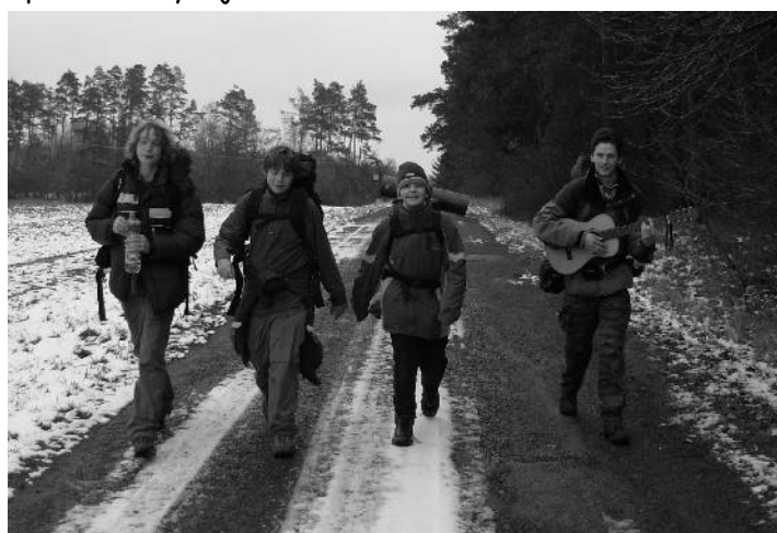
S písničkou se jde do světa líp

Mužem výpravy se stali současně Kuželka a Ministr a oba zaslouženě a známka byla 1,33 - díky Ministrově dvojce, jelikož cesta na vlak pro něj asi opravdu nebyla jednoduchá.