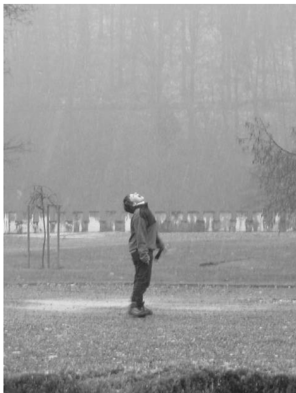
Jak asi chutná letošní sněh.