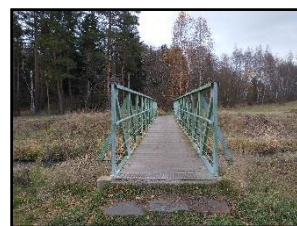
První přechod Litavky znamenal konec Příbrami, ten druhý (tentokrát v Podlesí) znamená začátek Příbrami.

OD KLOBOUČKU TU už je do Příbrami po neznačené trase (dá se jít i dále po červené, ale je to o asi 2 kilometry delší), takže nyní se hodí vytáhnout mapu. Pomalu se zase objevujete v civilizaci – z lesa vycházíte na kraji Obecnic. Po chvíli chůze po silnici ale ještě na nějakou dobu zacházíte do lesa (asi 500 metrů společně se žlutou značkou), abyste se pak objevili v Podlesí. Cestu vám také může před Podlesím zpříjemnit studánka U Podlesí. První přechod Litavky znamenal konec Příbrami, nyní vás v Podlesí čeká druhý, kterým naopak do Příbrami vcházíte. Nyní už každý jde jinam podle toho, kde bydlí. Výlet se blíží ke konci.