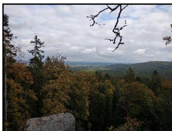
NAHOŘE: výhled z Kloboučku (703 m. n. m.)