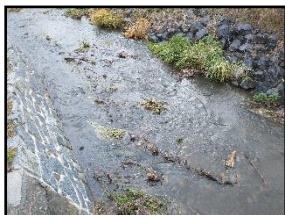
První most přes Litavku. Po přejití končí Příbram a začíná Staré Podlesí

MÁ CESTA ZAČÍNÁ už dopoledne. Na slunečné počasí to sice nevypadá, ale velká zima také není a hlavně – neprší. Z Příbrami vyrážím přes Březové Hory po zelené turistické značce a v ulici Pod Kovárnami přecházím Litavku – Příbram končí, jsem ve Starém Podlesí. Po chvíli mě čeká křižovatka – jdu rovně. Když vyjdu z dlouhého Orlova, konečně nadobro mizím v lese. A s civilizací mizí i lidé. Na rozcestníku je i šipka směr kopec Třemošná, ale tam dnes nejdeme.