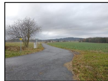
A přede mnou je Orlov, v pozadí Třemošná a vdáli (není vidět) Tok. Cesta doleva odtud vede do Lazce, doprava do Podlesí.