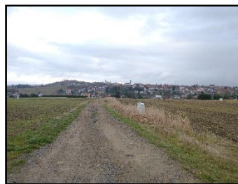
Litavka i Březové Hory jsou za mnou, a právě stojím na křižovatce. Za mnou je vidět Příbram...