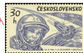
NALEVO: čára ukazující, kudy Gagarin proletěl. Foto: wikipedia.org ; NAPRAVO: československá poštovní známka, na níž je vyobrazen Gagarin. Foto: infofila.cz