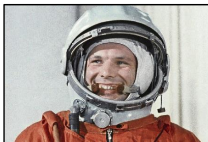
Jurij Gagarin.

Hlavními rivaly (samozřejmě) bylo SSSR a USA. V roce 1957 se SSSR povedlo vypustit první umělou družici Sputnik 1 a stejného roku byl na